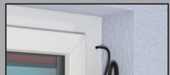
230 V Motorantrieb optional mit Fernbedienung