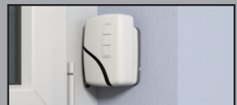
12 V Akku-Antrieb optional mit Fernbedienung kein Stromanschluß erforderlich