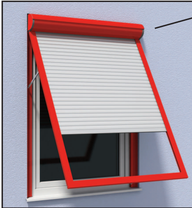
Cassetto Typ A