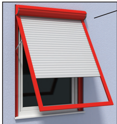
Cassetto Tipo A Tapparella pre-assemblata estensibile

Tapparella con „braccio di estensione a gomito“