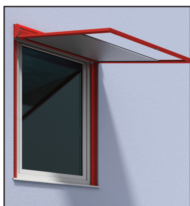
Cassetto Tipo C Tapparella pre-assemblata con accesso per la pulizia