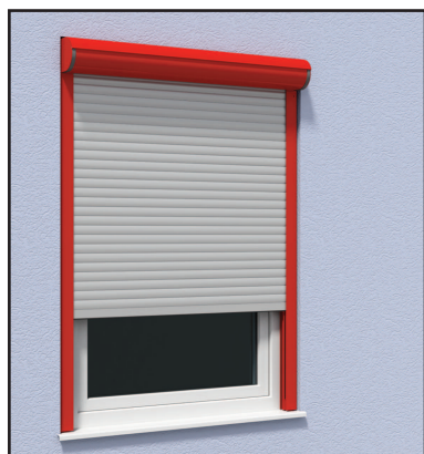
Cassetto Tipo B Tapparella pre-assemblata fissa