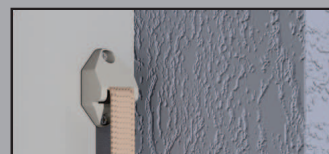
Utilizzo con la cinghia