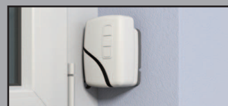
Azionamento con accumulatore 12 V

optional con comando a distanza senza allacciamento elettrico