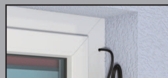
Azionamento a motore 230 V optional con comando a distanza

optional con comando a distanza senza allacciamento elettrico